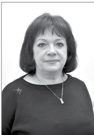
Ирина БУКИНА Судья Верховного Суда Российской Федерации

В Российской Федерации банкротами раньше могли объявить себя юридические лица и индивидуальные предприниматели. С 1 октября 2015 года это могут делать обычные граждане.